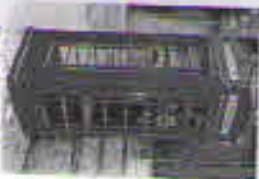
Red phone booth