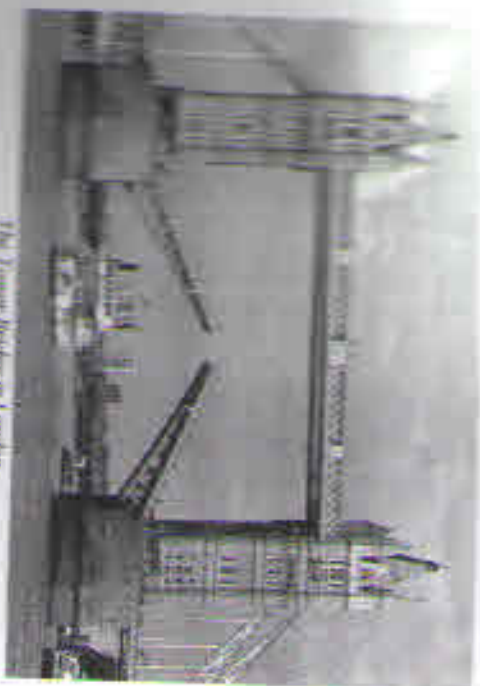
The Tower Bridge in London