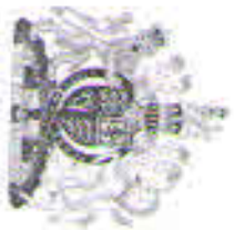
The coat of arms of the United Kingdom