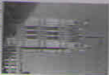
A King sits on the tower when Parliament is sitting during the day.