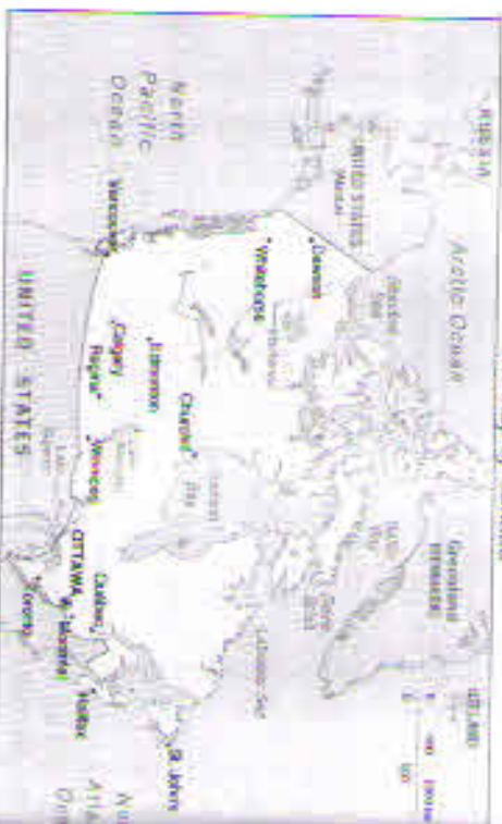
The map of Canada