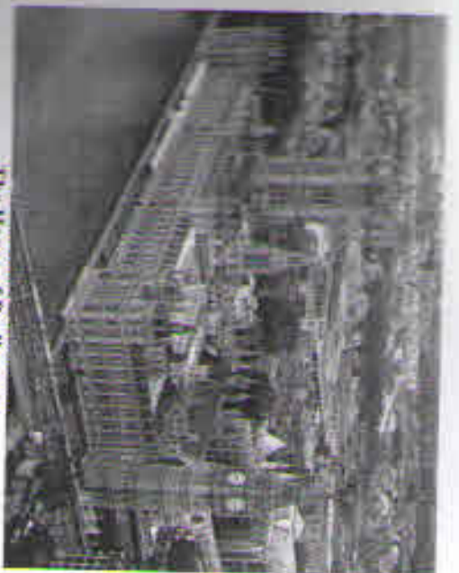
The House of Parliament