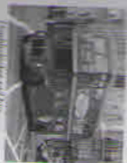
London's red bus