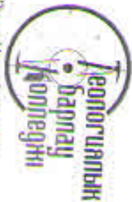
The emblem of our college