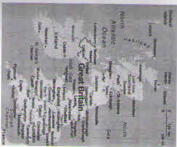
Great Britain: geographical position

The United Kingdom of Great Britain and Northern Ireland occupies a territory of the British Isles. Its total area is 244,100 square km. The UK is situated off the north-western coast of Europe between the Atlantic Ocean and the North Sea.