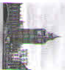
Big Ben is the huge bell in the Clock Tower on the end of the Houses of Parliament. It is 96.3 meters high.