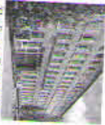
The Semey Geological Prospecting College