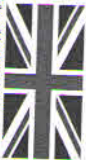
The flag of the United Kingdom of Great Britain and Northern Ireland